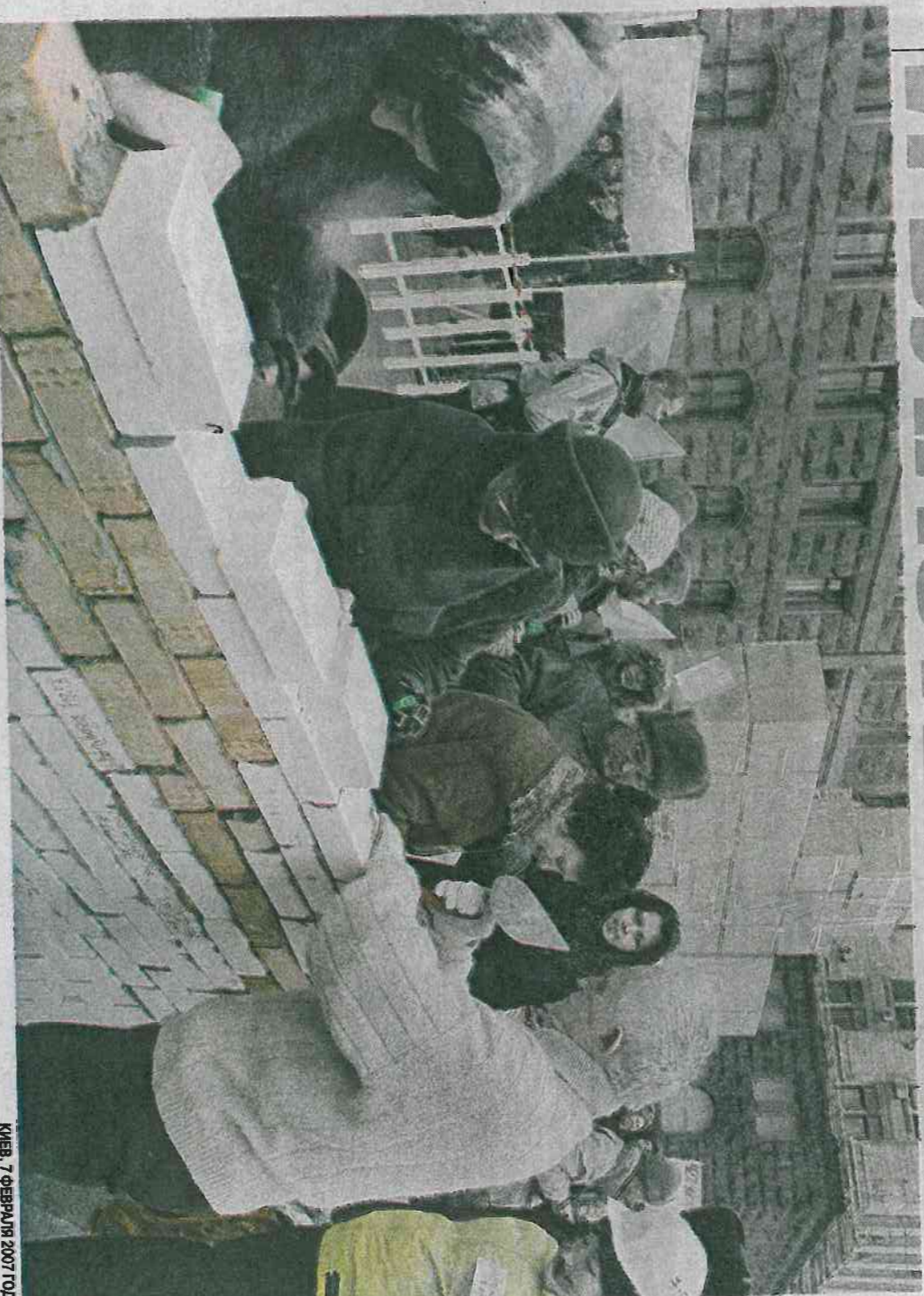
КИЕВ, 7 ФЕВРАЛЯ 2007 ГОДА. МИТИНГ УЧАЩИЕ СТРОИТ ПЕРЕД КТГА СТЕНА ИЗ ЮРТИЧА С ПОДПИСАМИ ОЗНАМЧУЮТЬ ВКЛАДЧИКОВ.

Так называемая «Сліпка брутально ошуканих громадян» подаєт в мэрию список из трехсот жертв «Длинта-Центра», которые должны получить квартиры. Выходит, больше тысячи остальных обманутых вкладчиков останутся ни с чем